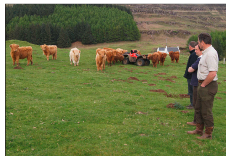
Kritisch werden Exportrinder begutachtet (Glengorm).

über den Atlantik heran, ungebrochen, weil total exponiert. Schnee und Eis sind auf den Inseln und in den Highlands eher selten, doch suchte im letzten Dezember ein harter Winter Glasgow heim, mit ungewohnten Minustemperaturen von 20 Grad. Von «Sommer» sprechen die robusten Insel-Schotten bereits, wenn das Thermometer mal über 15 Grad klettert... ms