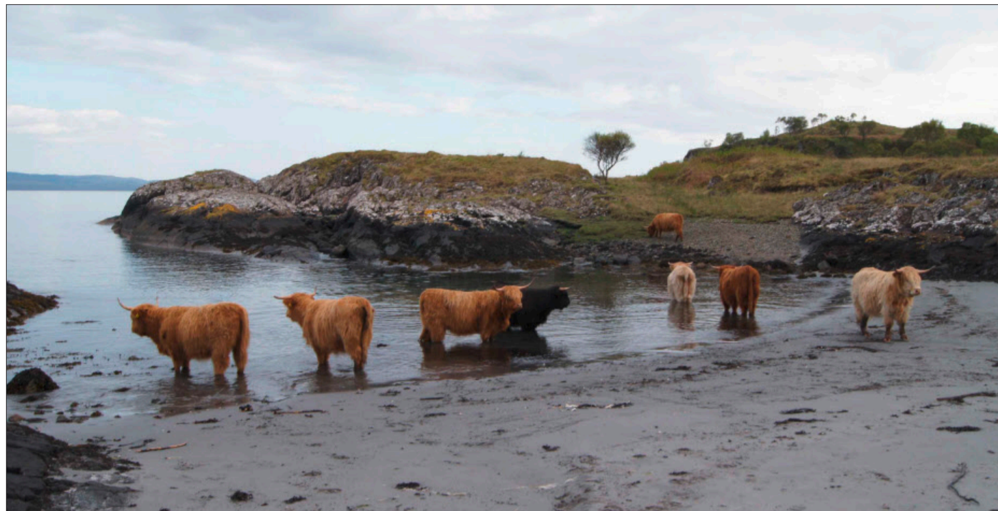
Bei warmem Wetter hochbegehrt: ein Plätzchen zum Planschen (Achnacraig, Insel Mull).